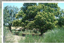
Soito, pomar de castanha ( Castanea sativa )