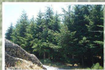
Povoamento de pseudotsuga ( pseudotsuga menziesii ) resignada não autóctone mas bem adaptada ao clima e ao solo da região.