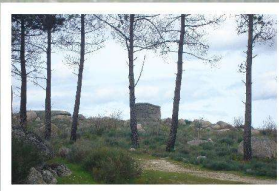
Guarita ou atalaia: estrutura de carácter defensivo